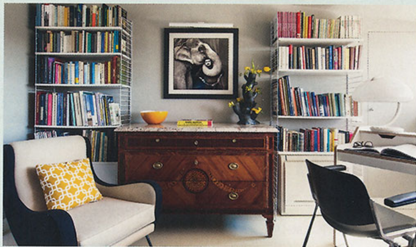
Incroci di epoche. SOPRA: il '700 dialoga con il design scandinavo dei '50. Style intersections. ABOVE: the 18th century talks with Nordic Fifties design.